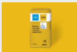
Zaprawy str. 16