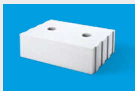
Silka – elementy uzupełniające str. 11