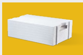
Ytong – elementy murowe str. 4, 5