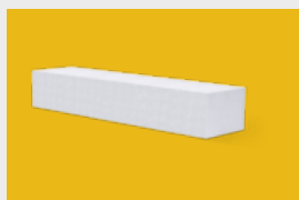
Ytong – nadproża str. 8, 9