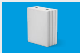
Silka Tempo – elementy murowe str. 10