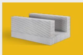
Ytong – kształtki U str. 7