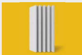
Ytong Panel – płyty do ścian działowych str. 6