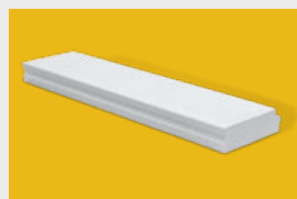
Ytong – płyty stropowe, dachowe i ścienne str. 6