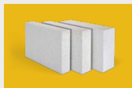
Multipor – mineralne płyty izolacyjne str. 12, 13