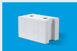
Silka – elementy murowe str. 10