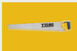
Narzędzia i akcesoria murarskie str. 14, 15